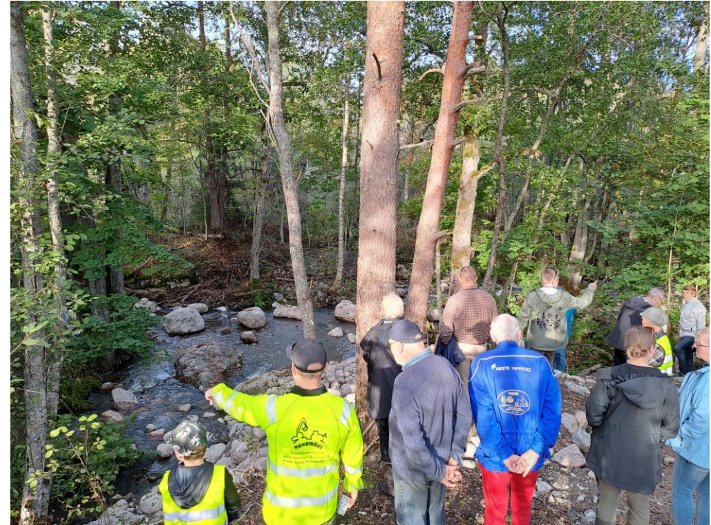
Kuva sidosryhmätilaisuudesta Holstenkosken kunnostushankkeen jälkeen, Salo. Perttu Tamminen